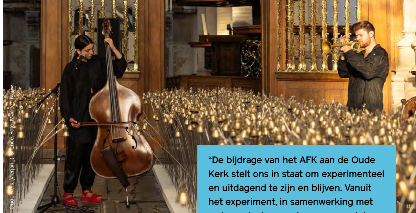
Oude Kerk (Vierjarig), Silence.

Ook de Oude Kerk ziet de waarde van ruimte voor risico, experiment en nieuwe samenwerkingspartners. In die samenwerkingsverbanden zit voor een groot