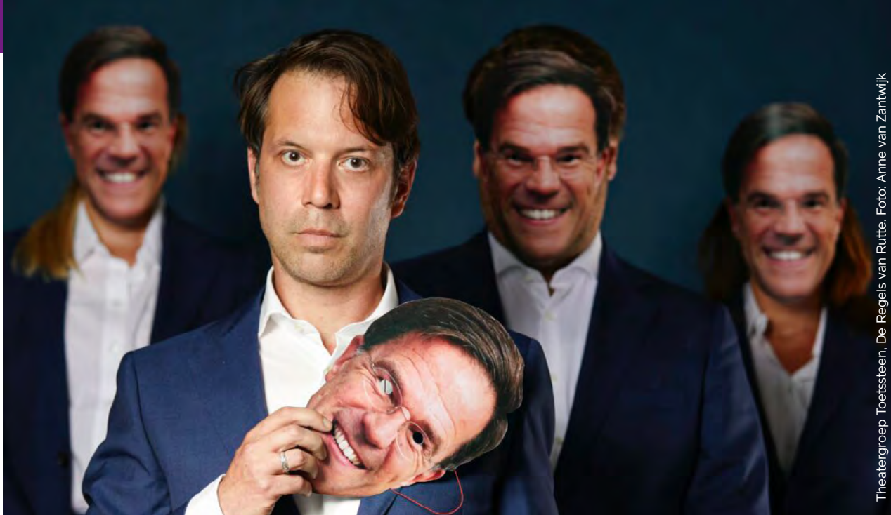
Theatergroep Toetssteen. De Regels van Rutte.

“Door in gesprek te gaan met het AFK, word je gedwongen om na te denken over het doen en laten van je organisatie. Ook maatschappelijke ontwikkelingen als fair practice en inclusiviteit worden door het AFK proactief op de agenda gezet. Dergelijke zaken dreigen soms ondergesneeuwd te raken in een door vrijwilligers gerunde organisatie.”