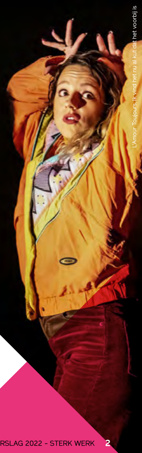
L'Amour Toujours. Ik vind het nu al kut dat het voorbij is